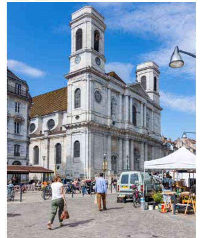
Quartier Battant, église Sainte-Madeleine