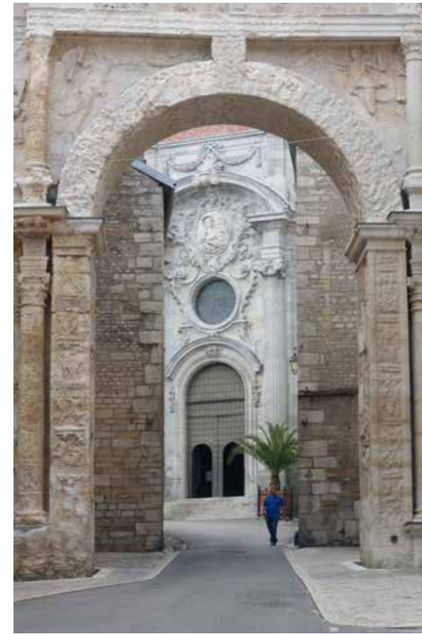
La Porte Noire