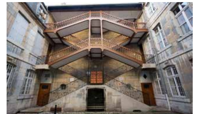
Escaliers rue Mégevand