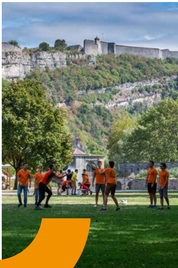
Le Grand Besançon, terre d'outdoor