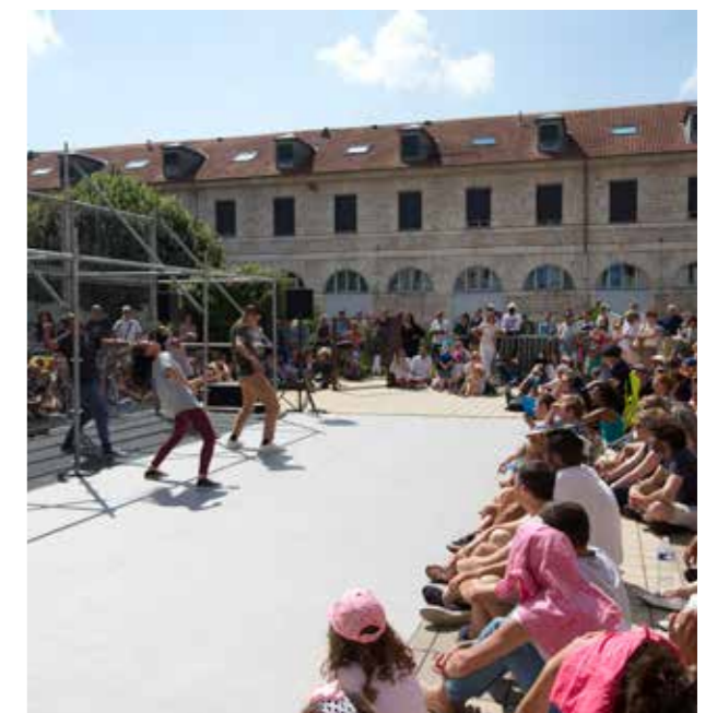
Jours de Danse