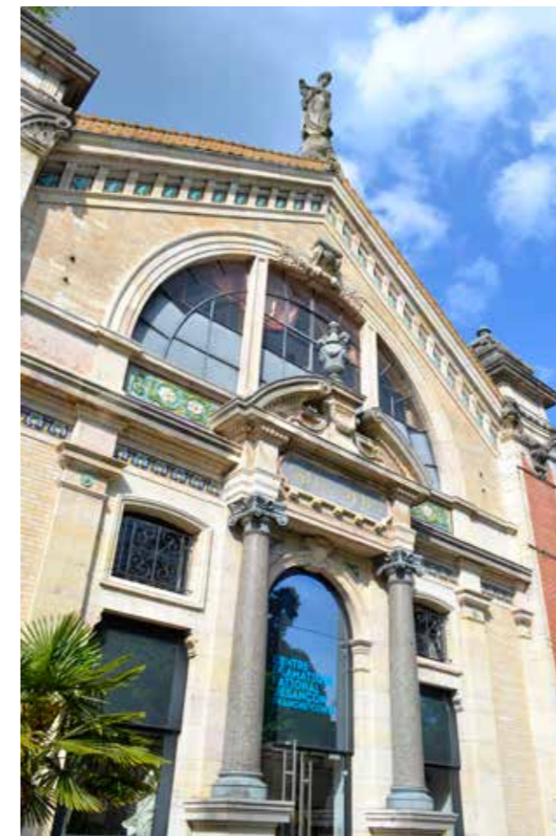
Centre Dramatique National de Besançon

Le cœur de l'agglomération est riche de plus d'un millier de commerces , de nombreux restaurants offrant une diversité de cuisines pour tous les goûts ! Certaines rues animées sont en saison une succession de terrasses où bars à vins et restaurants qui proposent de terminer la journée en dégustant quelques produits locaux.