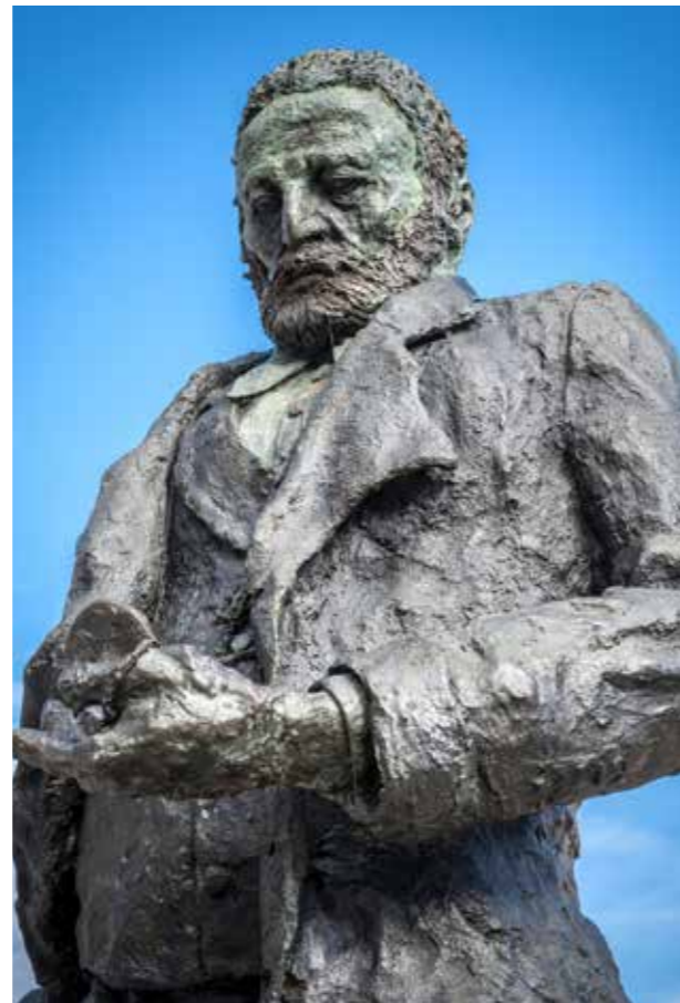
Victor Hugo — par Ousmane Sow