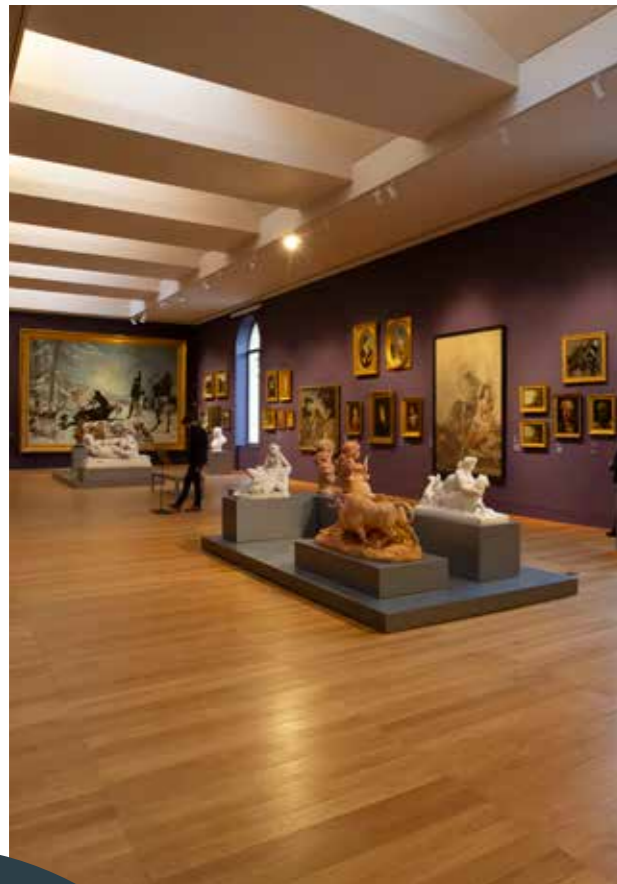
MBAA — salle XIX e siècle