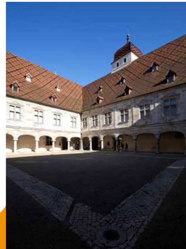
Cour du Palais Granvelle