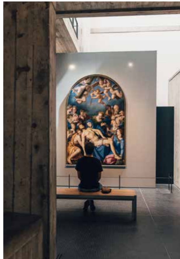
Bronzino, Déploration sur le Christ mort