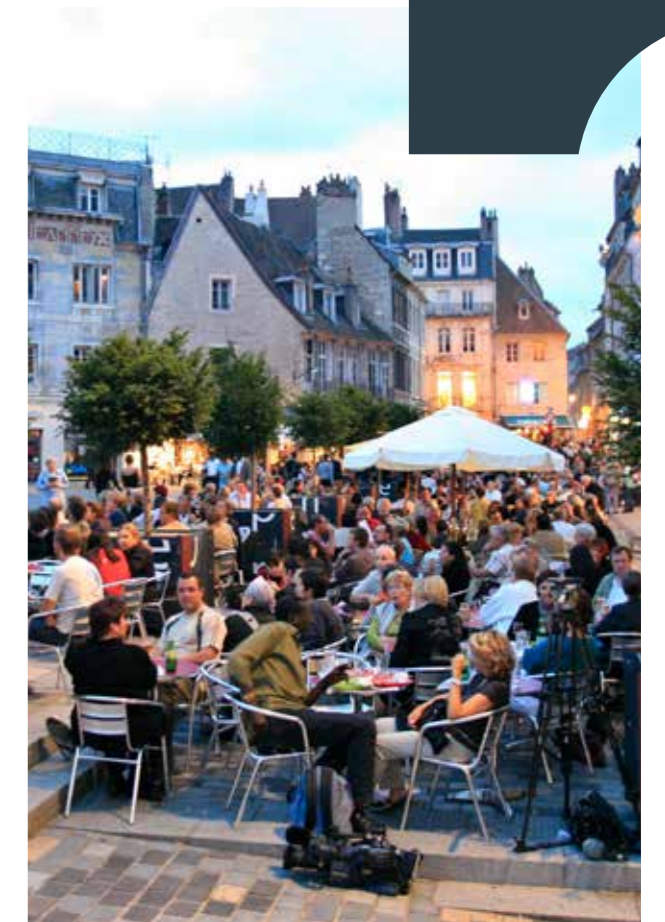
Place de la Révolution en soirée