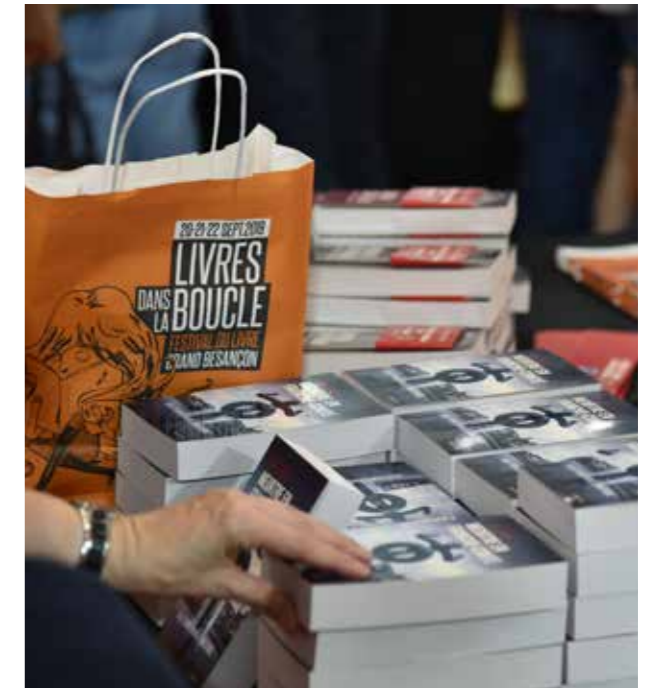
Livres dans la boucle

› www.livresdanslaboucle.fr › www.festivaldemontfaucon.com › www.ludinam.fr › www.festivaldecaves.fr › www.joursdedanse.compagnie-pernette.com