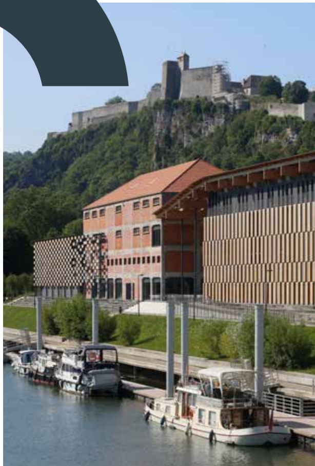
La Cité des Arts / le FRAC