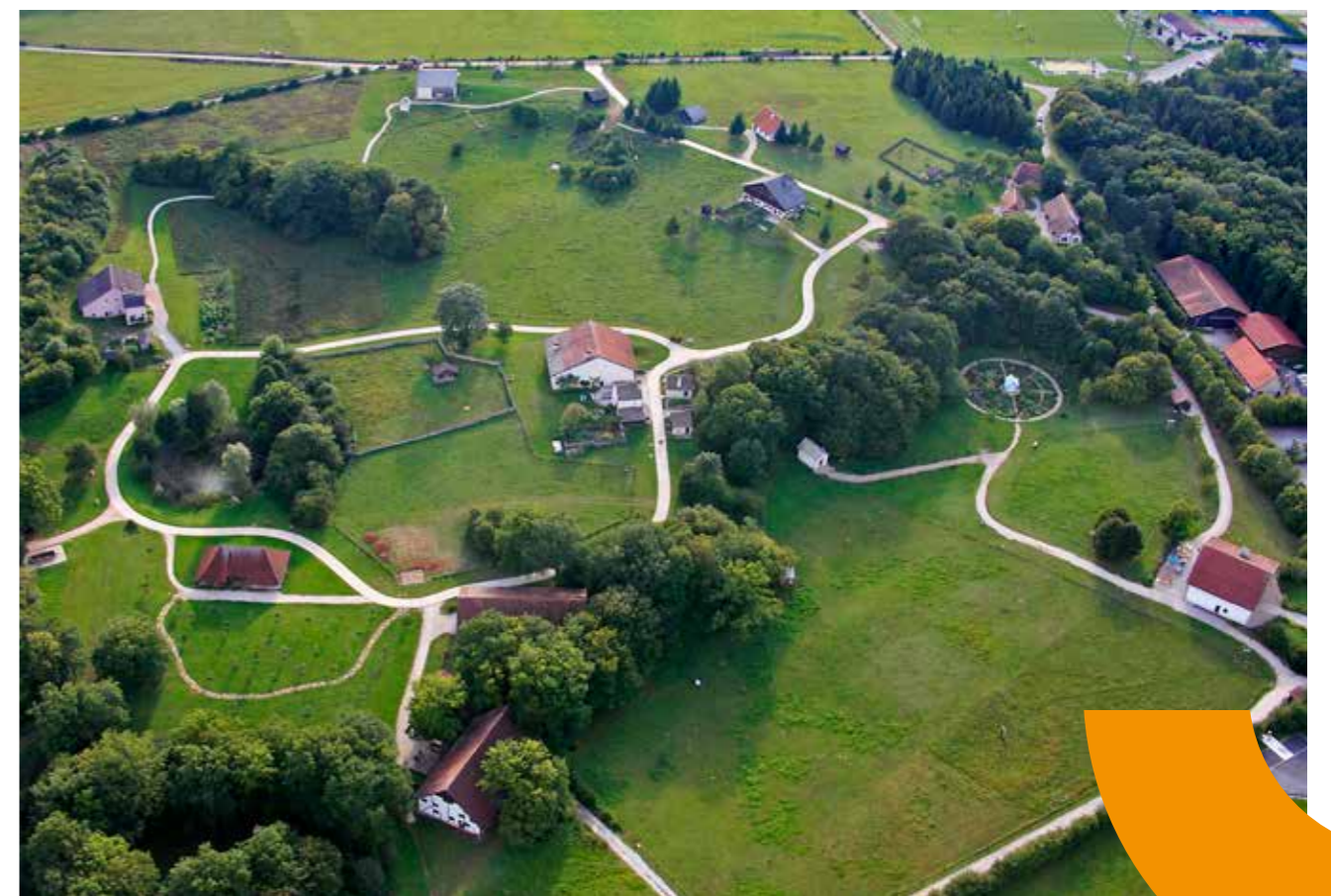
Musée des Maisons comtoises — vue aérienne du parc