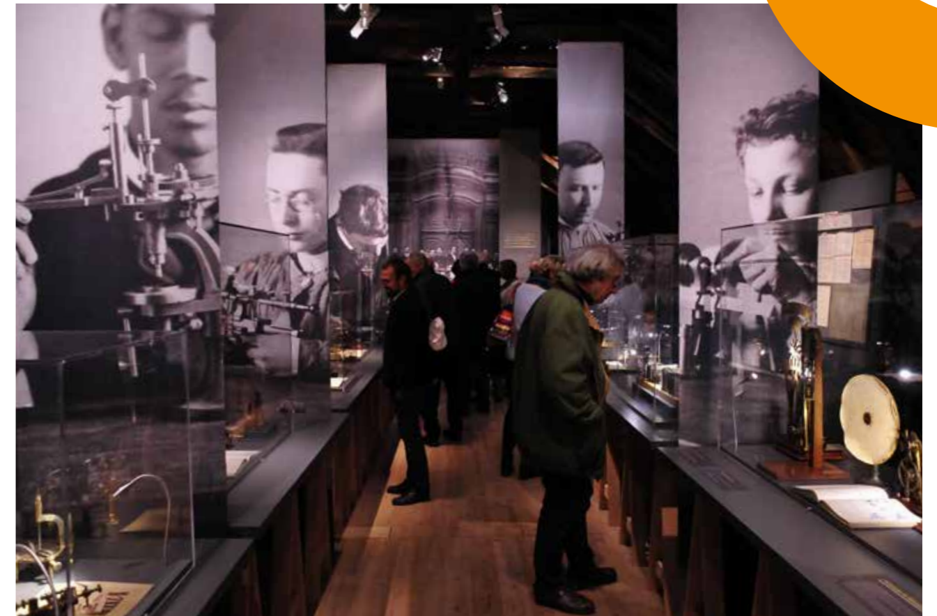
Exposition au Musée du Temps