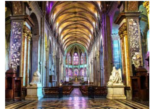
Cathédrale Saint-Jean — vue intérieure